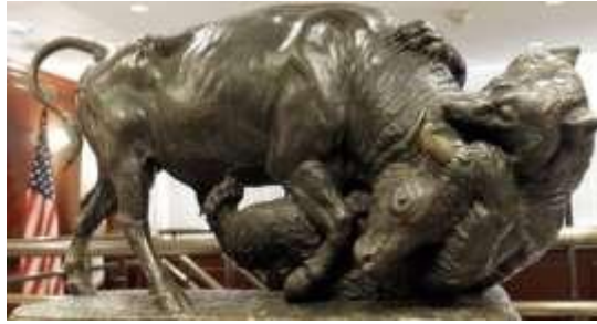
Bull and Bear market : hausses et baisses de l'économie

Au moment où se termine une année 2014 difficile, tant sur le plan climatique, social, politique, qu' économique, avec une tendance à la baisse caractéristique du « Bear Market » 1 , il est pertinent pour les astrologues et le public en général d'explorer les possibilités de l'astrologie financière. Peut-on se fier aux prévisions des spécialistes en astrologie financière? Sont-elles reconnues et utilisées par les milieux financiers?